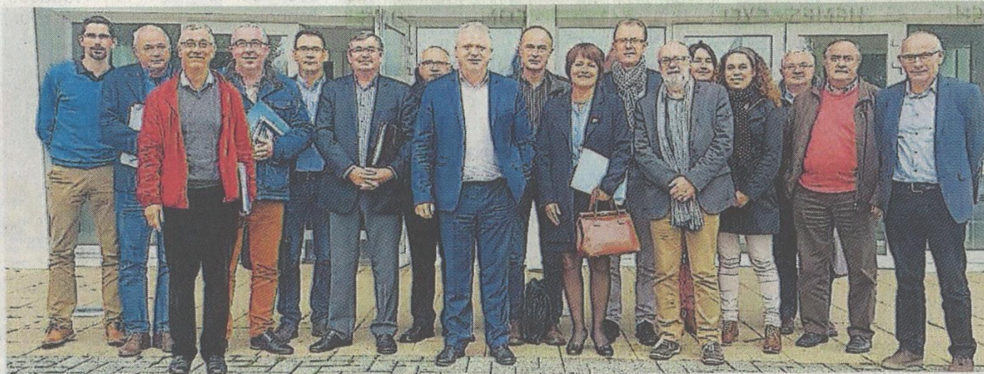
Les élus de l'Inter-Sage baie du Mont Saint-Michel se donnent un an pour transformer l'association en syndicat mixte.

L'Inter-Sage baie du Mont-Saint-Michel a été créé par la volonté des élus bretons et normands, de mettre en cohérence les politiques des Sage à l'échelle de la baie, dans l'objectif d'atteinte du bon état des masses