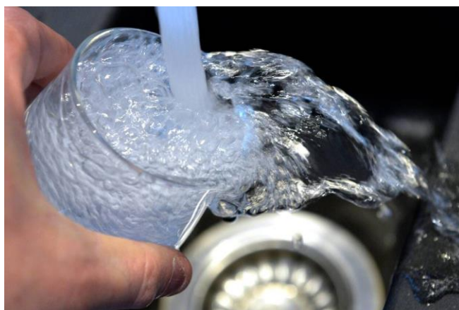
La collectivité Eau du pays de Saint-Malo évalue le risque de pénurie d'eau potable à 50 %. | OUEST-France