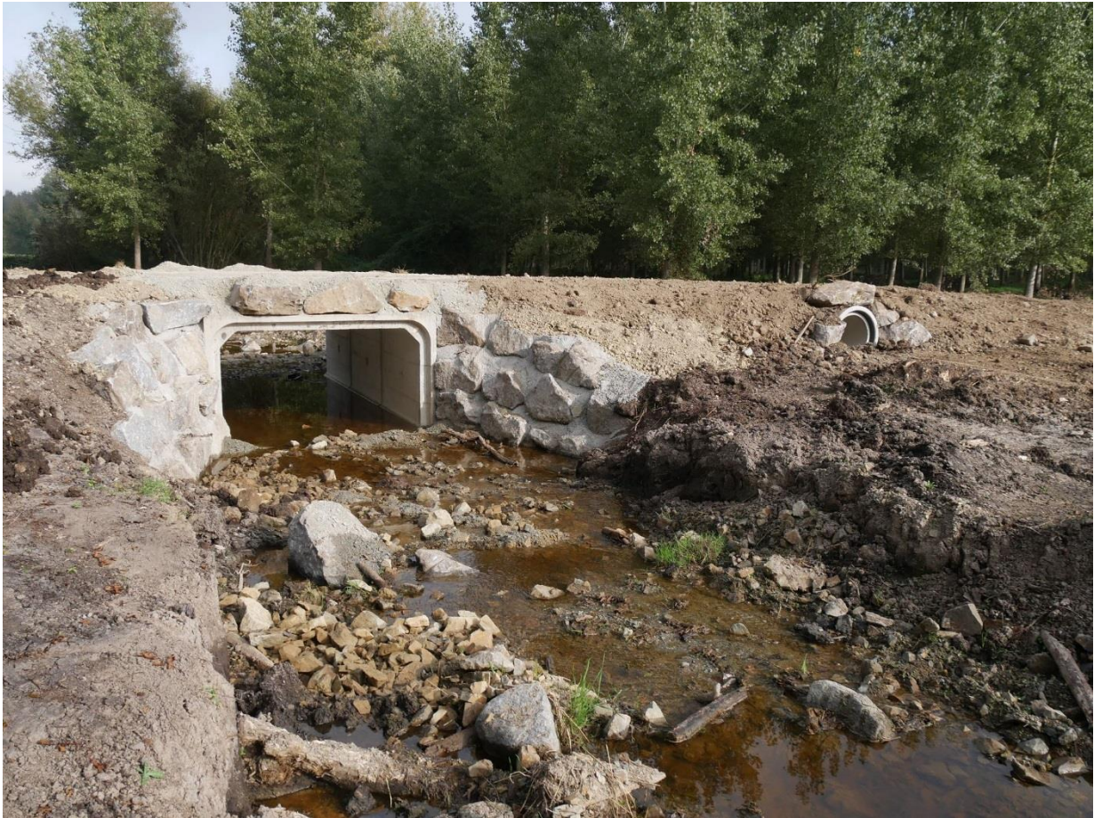
Le pont et le passage à faune avant aménagement final du site (voirie, garde-corps)

Le pont, dont le seuil constituait un obstacle à la circulation des poissons migrateurs, a été supprimé et un nouveau pont a été créé (en rouge sur le plan) une vingtaine de mètres plus loin, plus proche du fond de vallée. Un passage à faune a été installé pour permettre à la petite faune (batraciens, rongeurs...) de traverser la route.