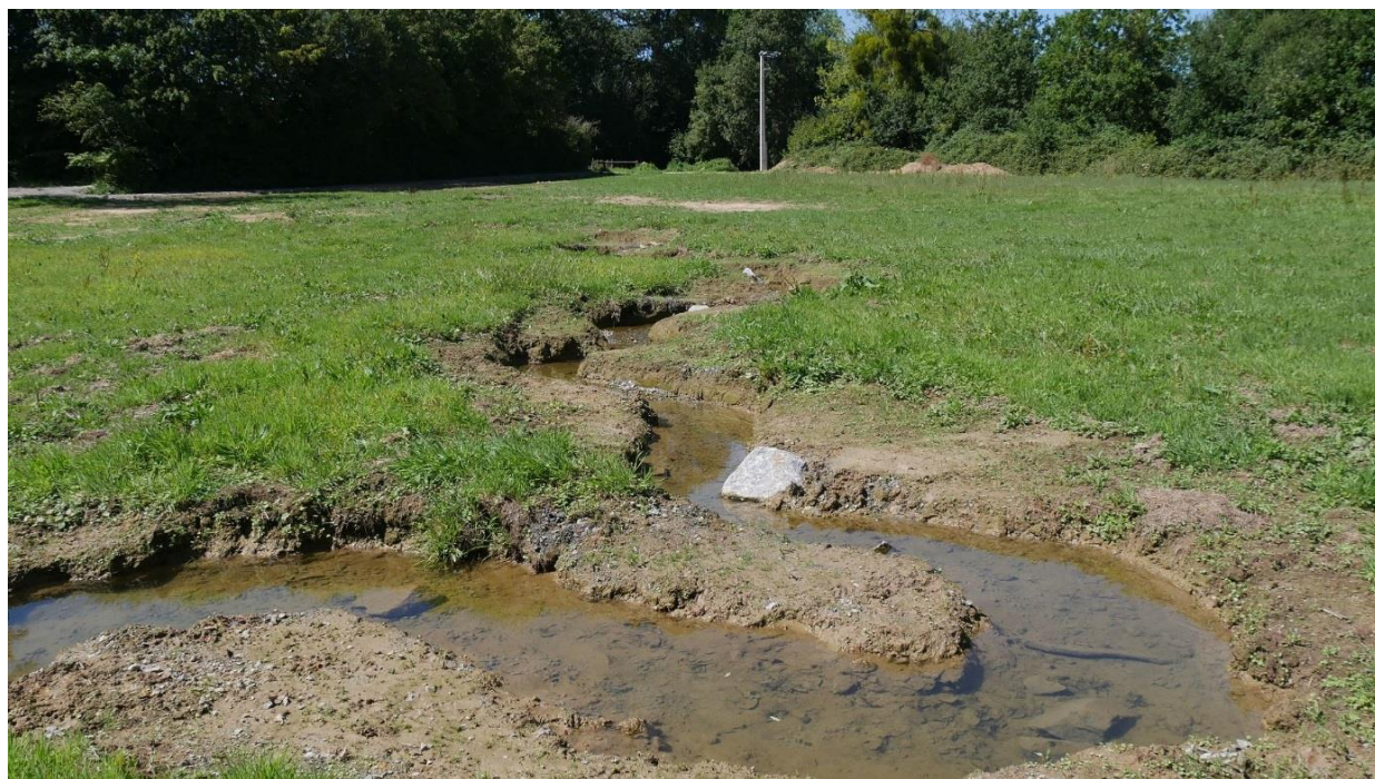
Le site après travaux

Le Syndicat des Bassins Côtiers de la région de Dol-de-Bretagne (SBCDol) vient d'achever les travaux de restauration du Ruisseau du lavoir, affluent de la Molène traversant la commune de Miniac-Morvan. Ces travaux ont été réalisés dans un objectif d'amélioration de la qualité, de la quantité d'eau et de la reconquête de la biodiversité ainsi qu'en préfiguration d'un parc intergénérationnel et d'un village sénior, au niveau du lavoir de la rue d'Abas. La commune poursuivra les aménagements dans les mois à venir pour faire de cet endroit un lieu de convivialité. L'installation de mobilier urbain et la réalisation de cheminements doux sont notamment prévues.